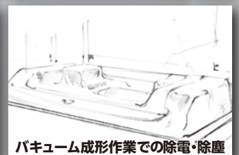
バキューム成形作業での除電・除塵