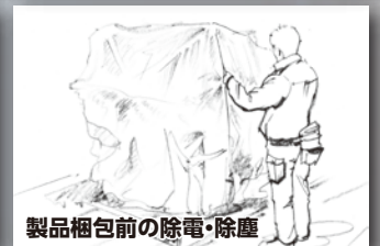
製品梱包前の除電・除塵