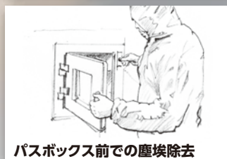
パスボックス前での塵埃除去