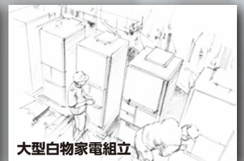
大型白物家電組立