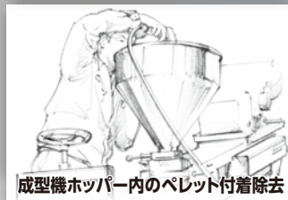
成型機ホッパー内のペレット付着除去