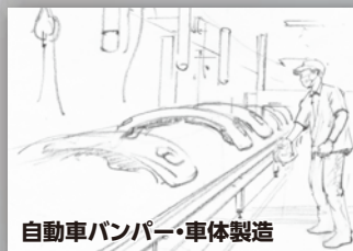
自動車バンパー・車体製造

例えば、成型機ホッパー内のペレット付着除去／医療機器製品の塵埃除去／ペットフィルム成形材料の電撃防止／樹脂切削後の切粉吹き飛ばし除去／商品梱包前の除塵／自動車整備工業での、車検・修理後のインパネ清掃／自動車修理工場での、パテ補修後や塗装前の除電・除塵などにご利用いただいております。