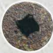
錆びてなめたネジ