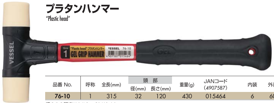
プラタンハンマー "Plastic head"