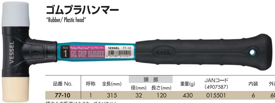
ゴムプラハンマー "Rubber/ Plastic head"