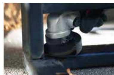
溶接部の仕上げ研磨