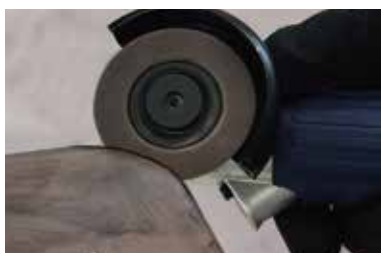
薄板板金のバリ取り