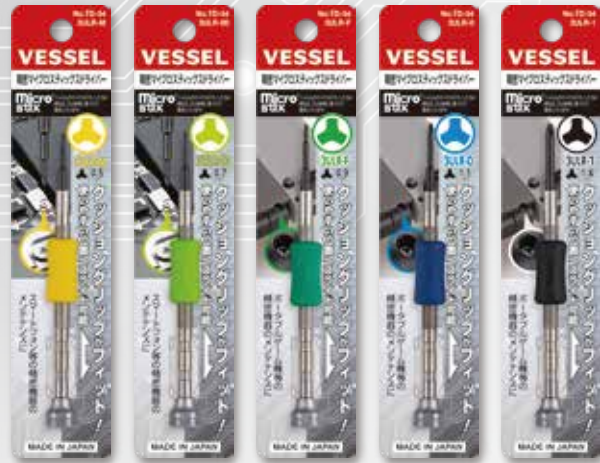
TD-54 3ULR-M TD-54 3ULR-00 TD-54 3ULR-F TD-54 3ULR-0 TD-54 3ULR-1